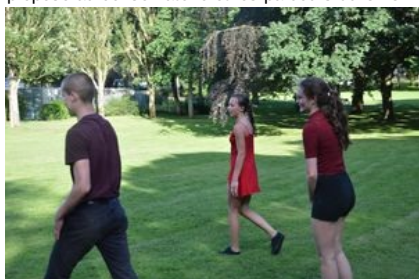
Performance danse contemporaine et hip hop

Une véritable orientation du parcours de l'élève est définie en cohérence avec son projet. En effet, des passerelles entre le cursus proposé au conservatoire et les parcours du CECAP sont possibles.