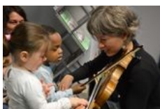
Découverte des instruments

S'interrogeant et innovant sans cesse dans ses tâches quotidiennes, l'équipe du Conservatoire de Lorient ouvre des chemins où chacun peut s'engager en toute confiance, quelque soit son parcours.