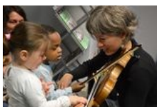
Découverte des instruments

S'interrogeant et innovant sans cesse dans ses tâches quotidiennes, l'équipe du Conservatoire de Lorient ouvre des chemins où chacun peut s'engager en toute confiance, quelque soit son parcours.